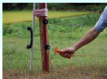
侵入防止柵の設置